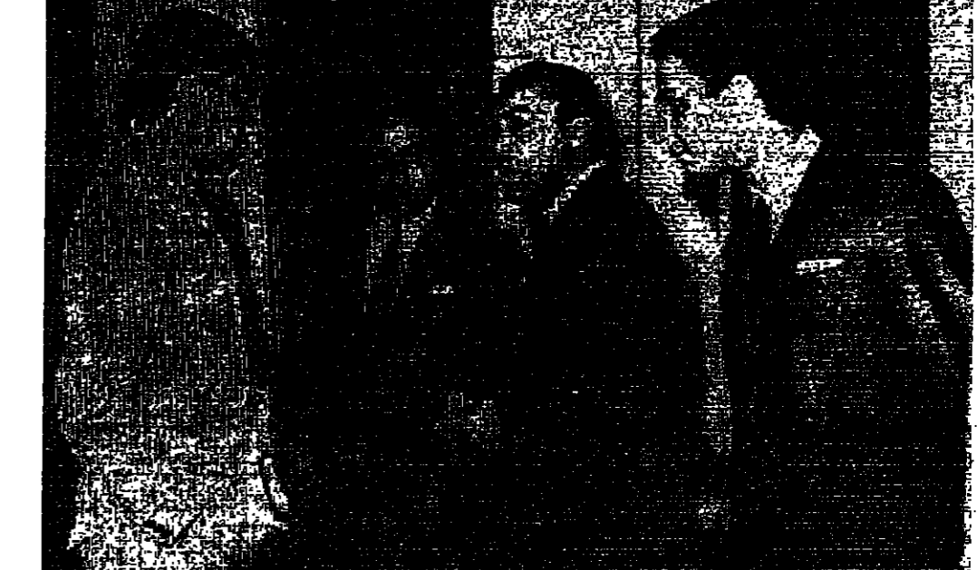
صورة لاسكيتية من اليونانيات خاصة بالنسبة للسيد الطبيب المحامي رئيس وفد تونس واعضاء وفده وهم يتسبحون من اجتماع اللجنة السياسية صباح امس

مجلس ينفق اليوم - تحديد ولاية حسونة سنة القاهرة - برقيا من أمين القطب - رويتر - وكالات الأنباء - وقع ما كان يخشاه المرابطون الدبلوماسيون واعتبروه حدثا مؤسفا في هذا الوقت بالذات الذي يتطلب اكثر من اي وقت مضى وحدة الصف والكلمة والجهد عندما انسحب الوفد التونسي من اجتماعات مجلس الجامعة العربية وغادر القاهرة عائدا الى بلاده . سبب الانسحاب وقد جاء انسحاب الوفد التونسي برئاسة السيد الطبيب المحامي سفي تونس في ليبيا من الجلسة الثالثة التي عقدها اللجنة السياسية صباح امس برئاسة التيقة على الصفحة الرابعة عمود ٧